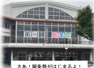
さあ！麗条祭が始まるよ！