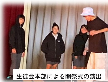
生徒会本部による開祭式の演出