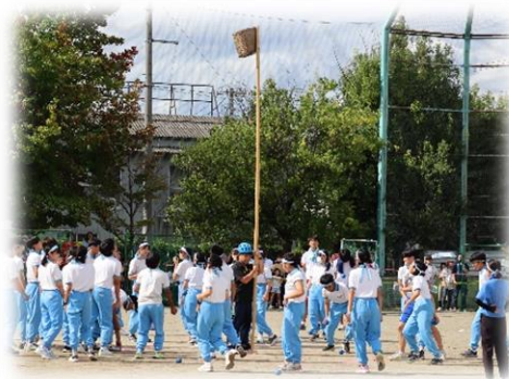
「挑戦」3年1組の玉入れ

生徒会本部役員と3年生がリードしながら、『革命』のテーマの下、全校生徒の誰一人として経験したことのない麗条祭を成功させることができました。麗条祭で高まった自主性や創造性、協和の心を今後の生活の中に生かし、全校生徒一丸となって、上条中をさらに良い学校にしていきたいと思います。感動をありがとう！！