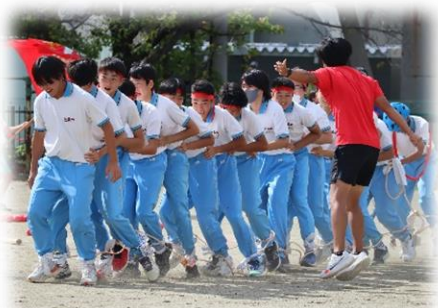
「挑戦」3年2組のムカデ競争

前日の夜から夜半に降っていた雨もすっかり上がり、さわやかな秋風を受けながら、2日目の体育部門を迎えることができました。開会式後に、①集団行動（ブロック対抗種目）、②台風の目（学年別クラス対抗種目）、③全員リレー（学年別クラス対抗種目）、④ブロック対抗リレー（ブロック対抗リレー）、⑤綱引き（ブロック対抗種目）、⑥挑戦（学年別クラス対抗種目）の全6種目を行いました。