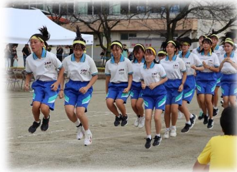
「挑戦」3年3組の長縄跳び