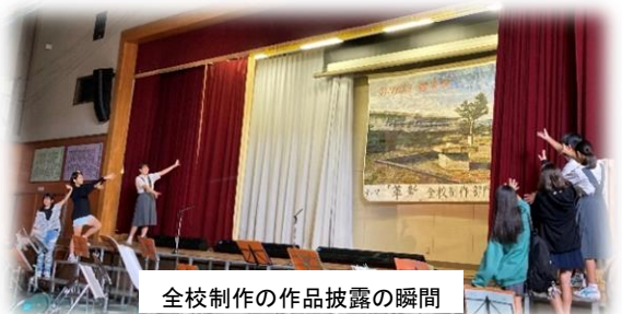
全校制作の作品披露の瞬間

本校の生徒会最大行事である麗条祭を、9月22日（金曜日：文化部門）・23日（土曜日：体育部門）の2日間にわたって開催しました。今年は例年以上に暑い日が続き、熱中症対策をしながら1学期末から取り組んできました。麗条祭当日は、心配していた暑さもやわらぎ、絶好のコンディションの中、今までの取り組みの成果を余すことなく発揮することができました。