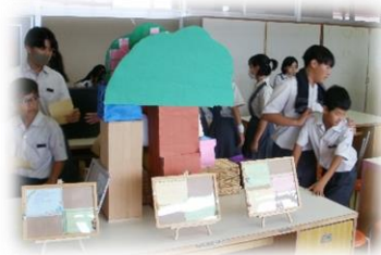
家政部もたくさんの見学者がいました

午後は校舎内での展示見学でした。部活動では美術部や家政部の製作物。各学年では修学旅行関係の製作物、職場体験学習のプレゼン、実技教科での製作物など、日頃から取り組んできた成果を見学しました。見学中のクイズの実施など、見学者を飽きさせない工夫が随所に見られました。