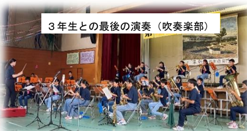
3年生との最後の演奏（吹奏楽部）

午前の後半は、各クラスで練習を重ねてきた成果を発表する合唱コンクールでした。どのクラスも指揮者・伴奏者と歌手が三位一体となり、素晴らしいハーモニーを奏でていました。最優秀賞は各学年1クラスしか選ぶことはできませんが、審査員の川崎先生も講評で「賞をつけるのが大変難しい」と言っていたように、賞以上の価値がある合唱を各クラスが創りあげていたと思います。このコンクールで終わらず、これからも皆さんの歌声が校内に響く学校であってほしいと思いました。