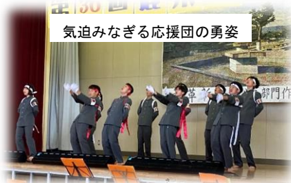
気迫みなぎる応援団の勇姿

1日目の文化部門では、開祭式で生徒会本部役員による寸劇、全校制作の作品発表、発表部門・展示部門の責任者から意気込みや内容の紹介などが行われ、とても和やかに麗条祭がスタートしました。続いて、応援団による気迫みなぎる応援や、吹奏楽部による上手なナレーションを交えながら、県吹奏楽コンクールでの演奏曲や「〇〇〇〇」など皆さんもよく知っている曲を演奏し、会場の雰囲気を一気に高めていました。