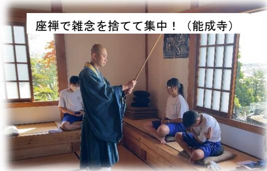
座禅で雑念を捨てて集中! (能成寺)