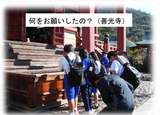
何を願いましたの? (善光寺)