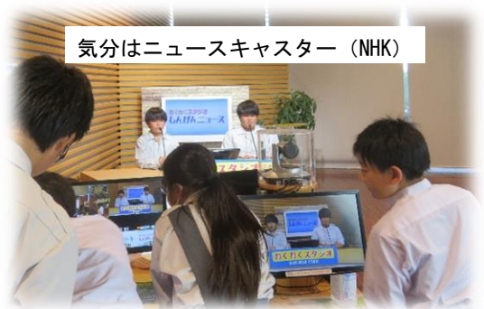
気分はニュースキャスター (NHK)

当日の朝、体育館に集まっている1年生の様子から、校外学習をととても楽しみにしてきたということがよくわかりました。元気に学校を出発し、普段乗り慣れていない電車やバスなどの公共交通機関を利用して班で力を合わせて、甲府の歴史や文化、産業などを学び、疲れながらもいい表情で無事に学校に帰ってきました。「お疲れ様でした！」