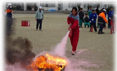
燃えさかる炎を消火する生徒

13年前に起きた東日本大震災の時、被災地の中学生たちは災害直後の避難生活で、救援物資の運搬、給水や炊き出しの手伝い、避難所の清掃など、自分達にできることを見つけて積極的に取り組み、避難生活の大きな力となったそうです。学校での避難訓練は年間数回行っているのですが、どのように避難したら良いはわかっていると思いますが、今後も、学校とは状況が違う地域の防災訓練にも積極的に参加して、もしもの時に避難生活となった場合、自分達は何ができるのかを考えるきっかけとしてもらえればと思います。