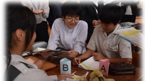
公開授業での話し合いの様子（10/25）

がんは、今や2人に1人が罹患する可能性がある病気であると言われていています。ここで学んだことを、今後の人生に役立てていくことを期待しています。