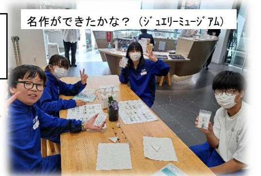
名作ができたかな? (ジュリエットミュージアム)