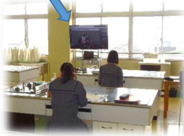
特別教室でのオンライン授業

3年生は14日から全員が登校しました。分散授業は、1クラスの生徒を教室と特別教室に分けて、教科担当の先生が教室で半分の生徒を対象に授業を行い、同じ内容を