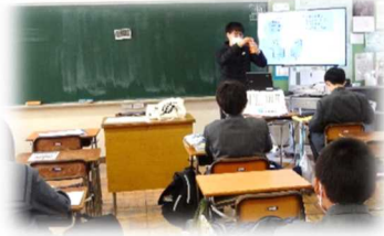
1年生 分散のため半分は空席

始まった当初から、1・2年生は「できる範囲で生徒同士の交流の場を作っていこう」ということで、Aグループは学校で、Bグループはオンラインで家庭から参加という具合に、