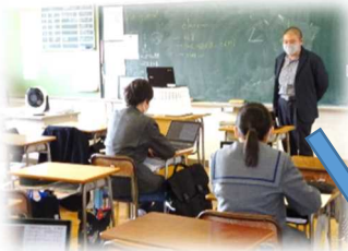
3年生教室での授業

特別教室にいるもう半分の生徒がオンラインで授業を受けます。始まった当初は、機器の関係でドタバタしていましたが、すぐに落ち着いた雰囲気です。授業を聞いて、さすが3年生だなと感心しました。卒業まで登校日数はあと9日。いよいよ1桁になってきました。大変な中ですが、義務教育最後のしめくりをみんなの手で！