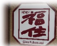
お世話になった「ギオン福住」