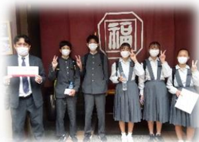
タクシーは旧クラスの班で