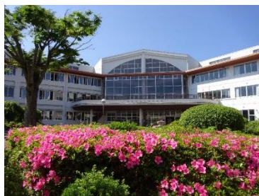
つつじの咲き誇る5月の校舎