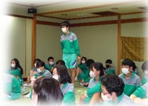
宿舎での学級の時間