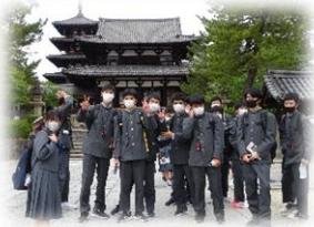
世界最古の木造建築